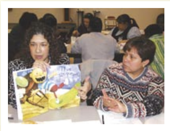
Nuestra comunidad tiene programas excelentes para involucrar a los padres en el mejoramiento de las escuelas.

Logan Square es un lugar para permanecer y crecer. Sobre todo, es un lugar para que las familias crezcan saludablemente – familias seguras de que sus casas son, y seguirán siendo, decentes y económicamente accesibles; familias con confianza en que sus niños están físicamente seguros y son intelectualmente estimulados en escuelas y jardines infantiles de buena calidad; familias sostenidas por el acceso a trabajos de importancia con salarios adecuados; familias orgullosas de su herencia étnica y cultural, y al mismo tiempo abiertas a la energía y diversidad que los recién llegados le agregan a la mezcla.