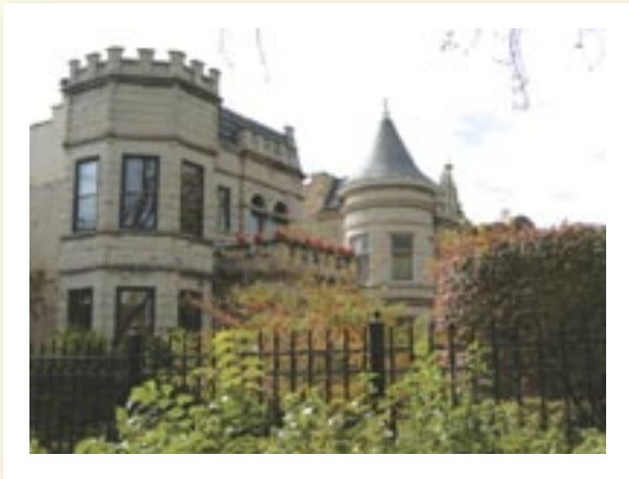
Mansiones elaboradas fueron construidas en los bulevares comenzando a fines de los años 1800.

Logan Square está en movimiento. Pero para muchas familias trabajadoras de este barrio del lado norte de Chicago, la pregunta persistente es si ellos también se tendrán que ir. ¿O puede ser posible controlar las fuerzas poderosas-pero-irreflexivas del mercado de bienes raíz, que van desde la zona de condominios al lado del lago hacia el oeste, y usar esas esfuerzos para entretejer un nuevo tipo de comunidad?